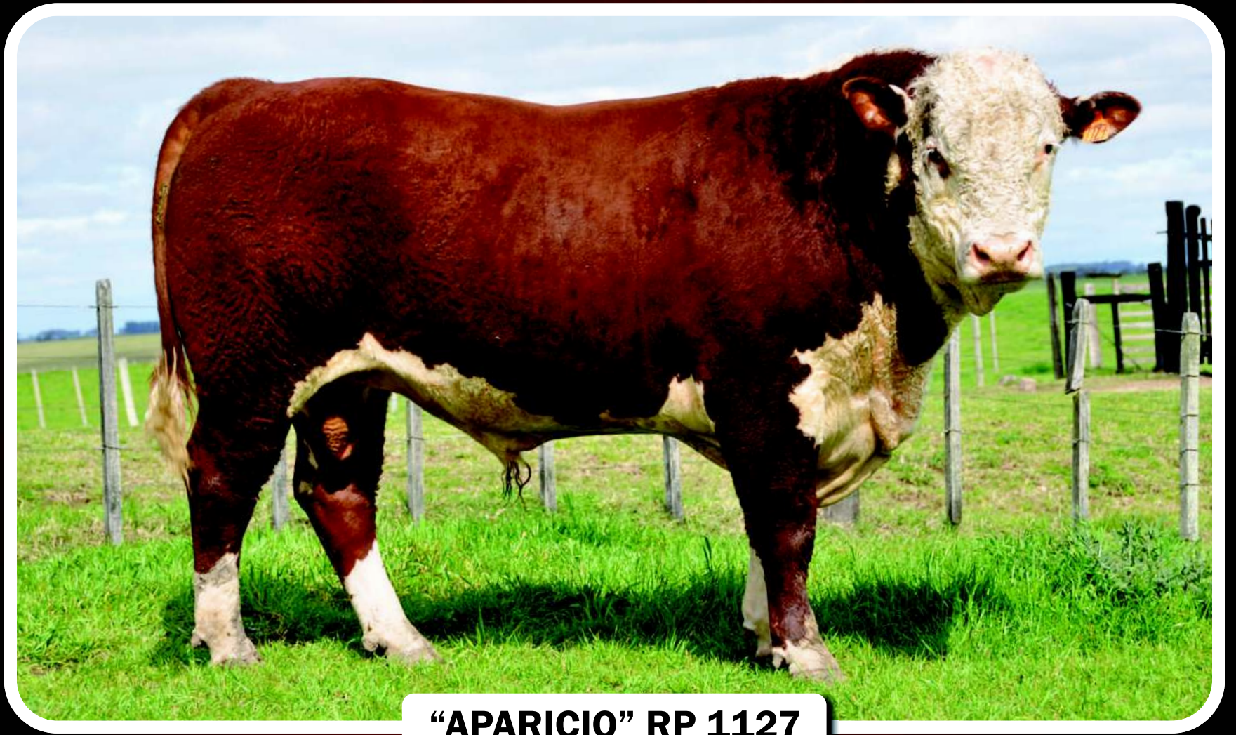
“APARICIO” RP 1127