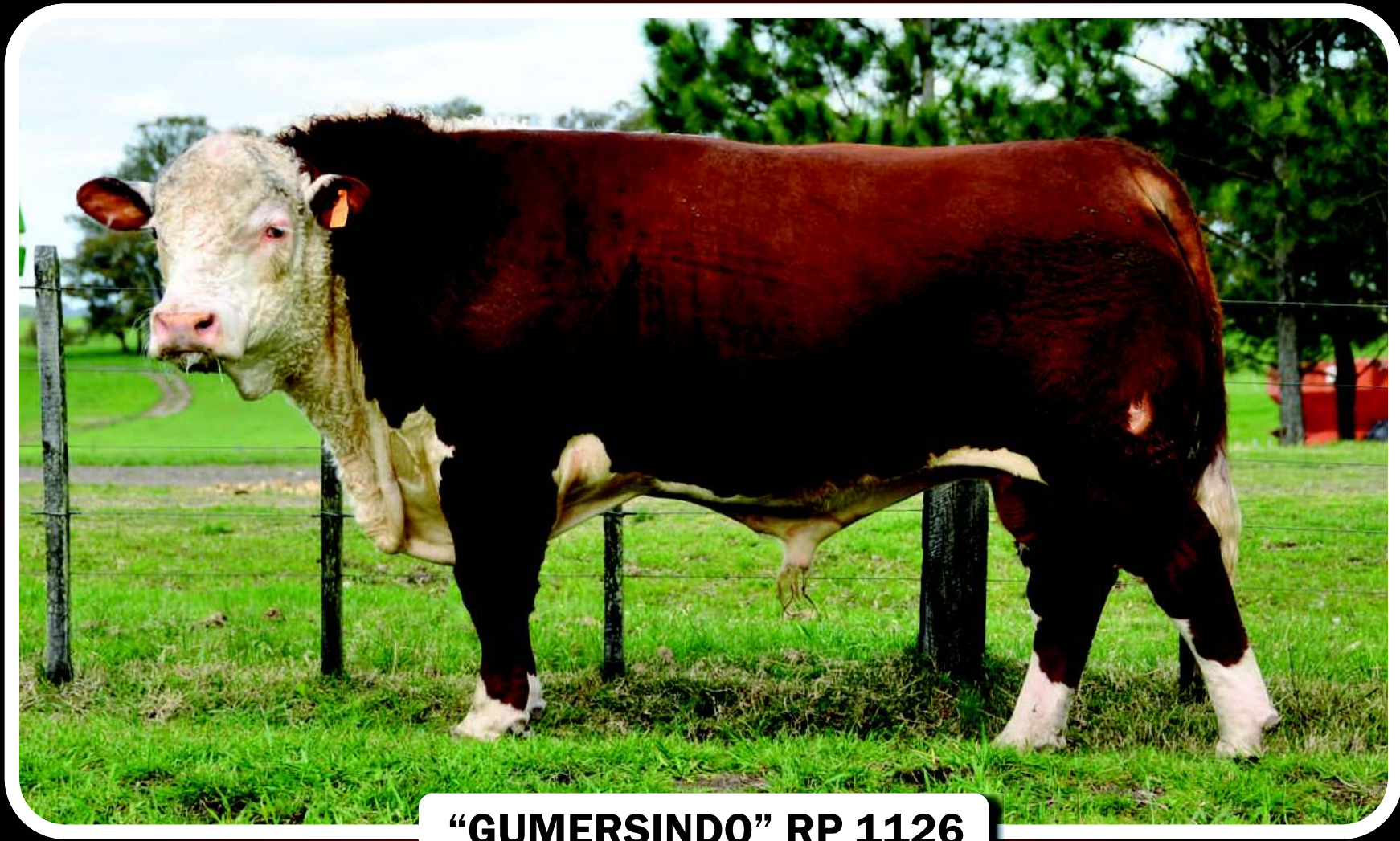
“GUMERSINDO” RP 1126