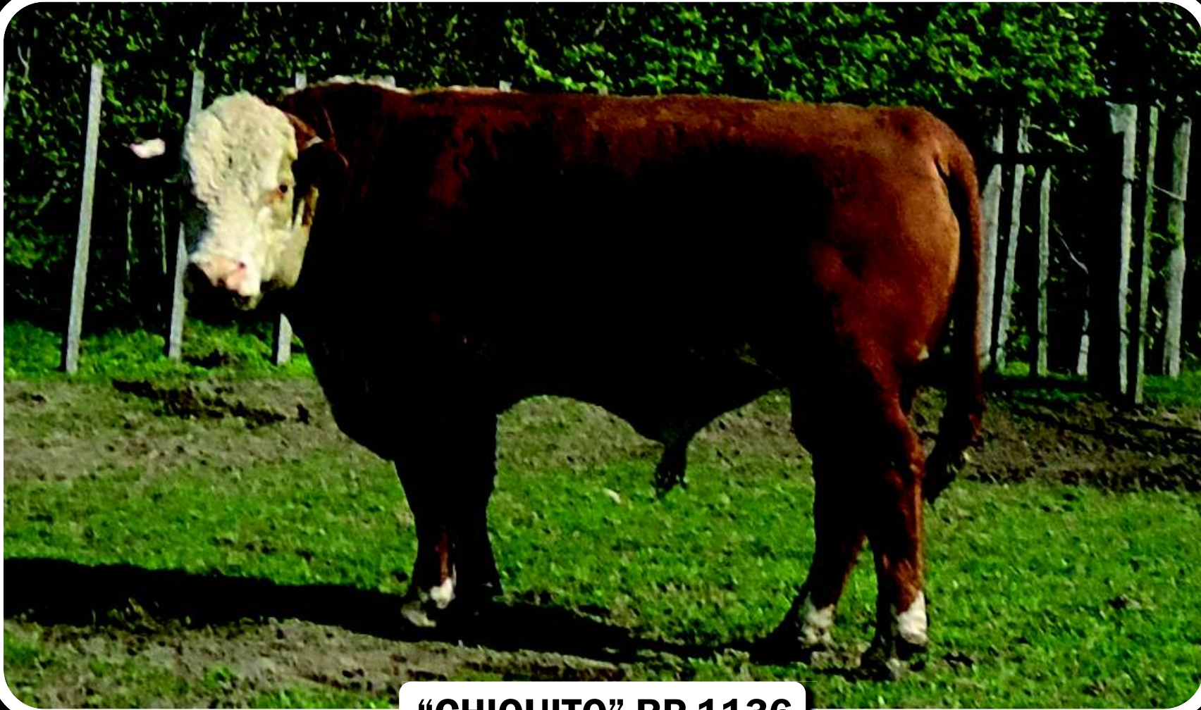
“CHIQUITO” RP 1136